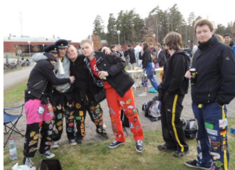
穿著 overall 的林雪平學生

林雪平大學的活動相當豐富，辦活動的組織大約有三個，分別為林雪平國際事務處、ESN 與 ISA。一整個學年下來，若常常參加他們所辦的活動，再加上其他組織辦的 party 的話，保證你的瑞典生活非常多彩和充實！剛到瑞典時，很不習慣他們的 party 文化，隨著待的時間一長，我竟也愛上和朋友一起喝酒瘋狂玩樂，和陌生人跳舞跳得滿身大汗的感覺。