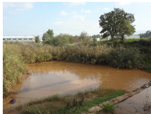
希臘受鎳汙染的河川

在我所選的課程裡，就屬 Water-Resource Management in Time and Space, focus Greece 最特別！這門課程為期一個月，真正上課聽講的時間不多，只有兩三堂吧。但學生們必須到希臘進行野外調查一個禮拜，超酷！學生們要自己定出有關希臘水資源研究的題目，只要和水有關即可，你可以做水汙染、水經濟、水規劃...。定出題目後，便必須自己在當地找資源，完成研究。這意味著什麼？你必須具備獨力解決問題的能力！老師完完全全都不幫你，只會協助你，給你方向，但你必須自己想辦法解決！原以為在希臘野外調查會很開心，結果竟然是水深火熱！在這一週裡，壓力真的好大好大阿。由於我們這組有換題目，所以變成進度延後，看著別組的同學撥空去看雅典建築，而我們只能待在房間乾瞪眼，真的是心有不甘阿。在一週的野外調查裡，突然深感亞洲人真的是太拼命了，明明做出來的報告品質不會比別人差，可是給自己的壓力都太多，深怕自己做不好，我們應該更有自信點！相信自己！