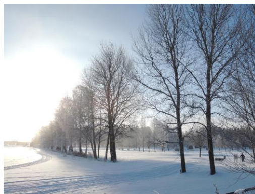
走路上學經過的高爾夫球場

瑞典是個乾冷的國家，還記得飛機抵達阿蘭達機場，我拖著負載行李的推車，手一直被靜電電到，電到的次數很頻繁，都快要抓狂了。但隨著待在瑞典的時間一長，靜電也似乎不那麼常發生在我的生活中了。瑞典的天氣變化很大，有時候早上還出大太陽，下午卻白雲密布，只能說瑞典的天氣變化莫測阿！瑞典的天空非常漂亮，天氣晴朗時，天空蔚藍，白雲純白，這應該歸於瑞典的汙染非常少。仔細抬頭一看，你會覺得天空離你好近。